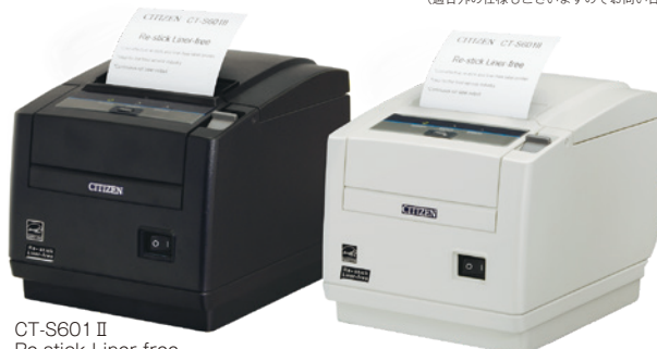
CT-S601 II Re-stick Liner-free